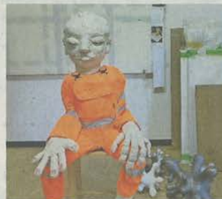
Ruth Loibl, „Redeopersonal“